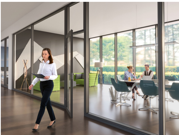
Cierre silencioso de puertas, para una concentración sin interrupciones en la oficina.