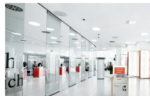
Progetto di banca: Sparkasse Rhein-Haardt, Architetti: PARTNER AG