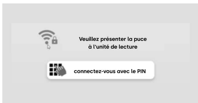
2. Connexion via PIN