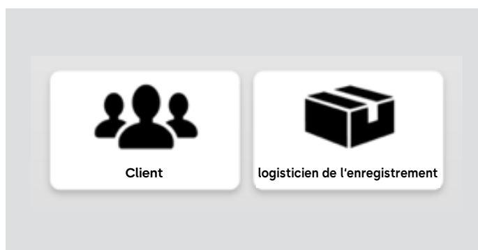
1. Cliquer sur le bouton « Client » ou « Résidents »