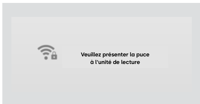
4. Maintenir le média face à l'unité de lecture RFID