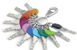
Pour la clé standard, les clips Smartkey existent en 12 couleurs