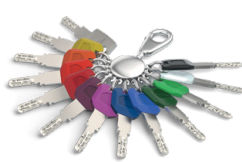
La clé avec clip Largekey est disponible en 12 couleurs.