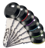
Sur les clips à transpondeur RFID, 6 éléments circulaires colorés facilitent la reconnaissance.