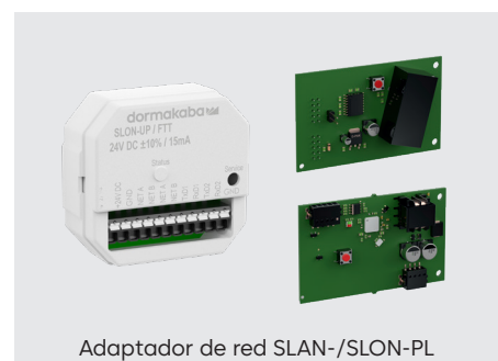
Adaptador de red SLAN-/SLON-PL

Los sistemas de paneles SCMC (SafeRoute Central Management Control) permiten supervisar y controlar en tiempo real puertas individuales, grupos de puertas y secciones espaciales. En función de los requisitos, un sistema de paneles se puede montar individualmente de acuerdo con la norma EN 13637 mediante la combinación modular de insertos de paneles y se puede adaptar a los requisitos del objeto correspondiente.