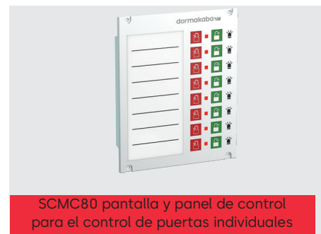
SCMC80 pantalla y panel de control para el control de puertas individuales