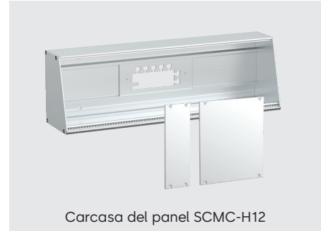
Carcasa del panel SCMC-H12