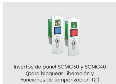
Insertos de panel SCMC30 y SCMC40 (para bloquear Liberación y Funciones de temporización T2)