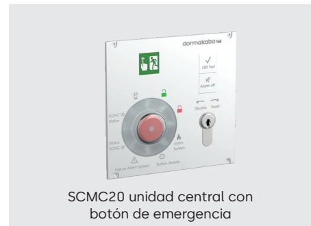
SCMC20 unidad central con botón de emergencia