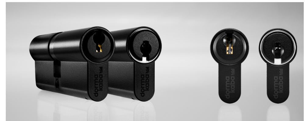
Mismo color negro para sistemas de serreta y reversibles